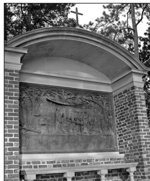
Robert Hunt Shrine, Jamestown

Un santuario de piedras, donado por las Damas Coloniales de América en Virginia, conmemora el ministerio de Hunt fundando la primera congregación protestante en América. Hunt fue muy apreciado por todos, estaba acostumbrado a las penurias y durante el viaje estuvo enfermo varias veces. Todos sus libros y sus otras posesiones fueron destruidas en 1608 durante el incendio de Jamestown.