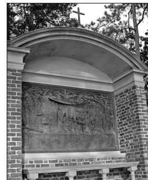
Robert Hunt Shrine, Jamestown

Un santuario de piedras, donado por las Damas Coloniales de América en Virginia, conmemora el ministerio de Hunt fundando la primera congregación protestante en América. Hunt fue muy apreciado por todos, estaba acostumbrado a las penurias y durante el viaje estuvo enfermo varias veces. Todos sus libros y sus otras posesiones fueron destruidas en 1608 durante el incendio de Jamestown.