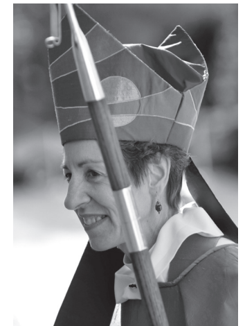
Katharine Jefferts Schori

— S. E. Rvma. Katharine Jefferts Schori es Obispa Presidenta y Primada de la Iglesia Episcopal.