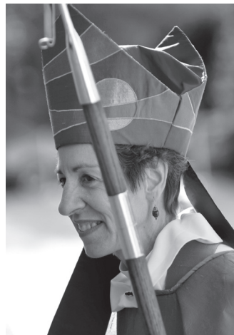
Katharine Jefferts Schori

— S. E. Rvma. Katharine Jefferts Schori es Obispa Presidenta y Primada de la Iglesia Episcopal.